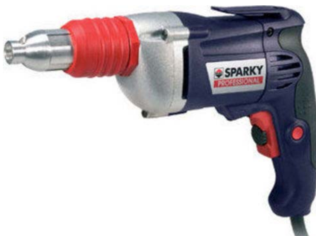
винтоверт BVR 64E

Производителят на електроинструменти "Спарки Елтос" (ELTOS) беше награден с два златни медала на Международния технически панаир гр. Пловдив, съобщиха от БФБ - София. Експонатите, които спечелиха златен медал и диплома са продукти, които се отнасят към гамата от произведжаните от завода електроинструменти, като наградените модели са къртач K 306E и фамилията винтоверти с модели BVR 64E и модификации BVR 62E и BVR 66E. "Спарки Елтос" е лидер по продажби на електроинструменти в България с дял от около 20%, но основната част от приходите му се формира от продажба при износ. Продукцията на предприятието се реализира чрез дилъри и дистрибутори на едро.